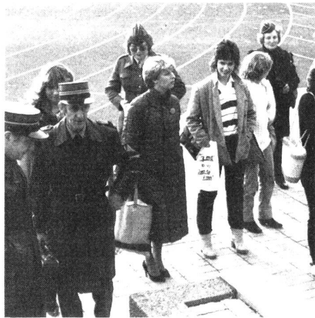
Recrutement terminé. Au prochain rassemblement on s'aligne.