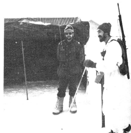
Sektion Bern: Einsatz mit SE-125

Seit dem 3. Februar 1982 ist das Basisnetz wieder auf Funkbereitschaft. Am 1. und 3. Mit-