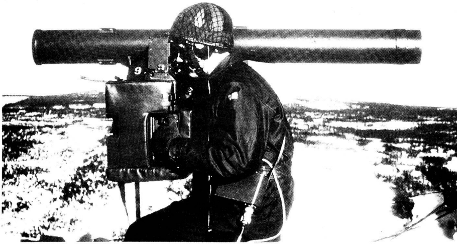
Ein norwegischer Soldat bei der Übung im RBS-70-Simulator. Der Simulator ist ein wichtiger Bestandteil des Systems und erlaubt eine schnelle und gründliche Ausbildung zu niedrigen Kosten.

Das Lenkwaffensystem RBS 70 wird seit 1976 von Bofors serienmässig hergestellt und ist in dieser Zeitspanne kontinuierlich weiterentwickelt worden.