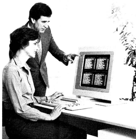
Dank der neuen Technik (Plasma-Leuchtplatte und Funktionen im Mikrocode) kann das neue IBM-Bildschirmterminal 3290 in Unterbildschirme aufgeteilt werden, gleicher oder unterschiedlicher Grösse. Diese Aufteilung gestattet jedem Unterbildschirm eine Anwendung zuzuordnen, was vielfältige Kombinationsmöglichkeiten erlaubt.

Das Informations-Anzeigegerät 3290 setzt sich aus einem Bildschirm, einer Logikeinheit und einer Tastatur zusammen. Ein Zusatz von 25 numerischen oder von 25 programmierbaren Funktionstasten ist möglich. Die maximale Anzeigekapazität beträgt 62 Zeilen zu 160 Zeichen. Sie lässt sich in vier Unterbildschirme mit 31 Zeilen zu 160 Zeichen oder in zwei vertikale Unterbildschirme mit 62 Zeilen zu 80 Zeichen unterteilen.