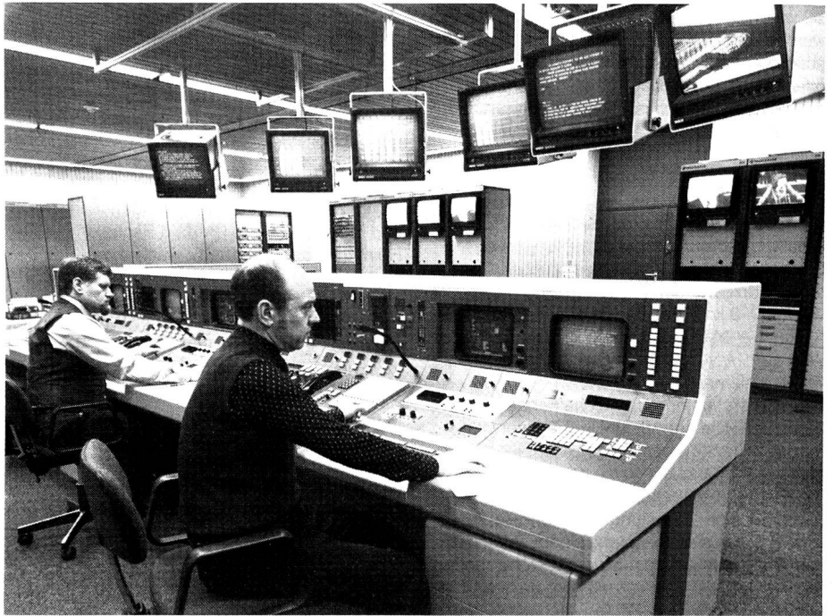
Blick in den Steuerraum der neuen Funkempfangsstelle des deutschen Bundespresseamtes.

Die für die Steuerung der Empfangsanlage erforderlichen Daten sind auf dem Disketten-Hintergrundspeicher abgelegt. Während die Senderbibliothek alle relevanten Daten der zu empfangenden Sender enthält, sind in der Anlagen-datei die für die Steuerung relevanten Daten der Empfangsanlage gespeichert. Das eigentliche Empfangsprogramm wird über eine Wunschliste, welche die Sollvorgaben enthält, aus der Senderbibliothek und der Anlagen-datei interaktiv erstellt. Das Empfangsprogramm kann bis zu 475 permanente Empfangseinstellungen und bis zu 25 einmalige Einstellungen umfassen.