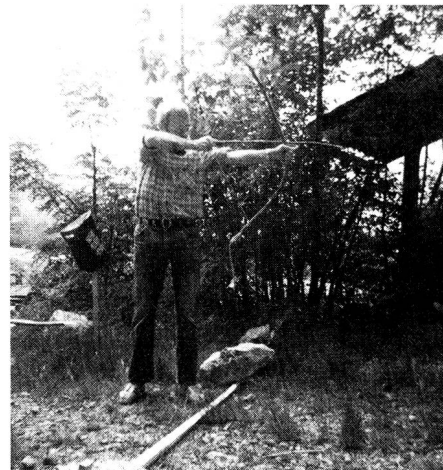
Ob's wohl ein Treffer wird?