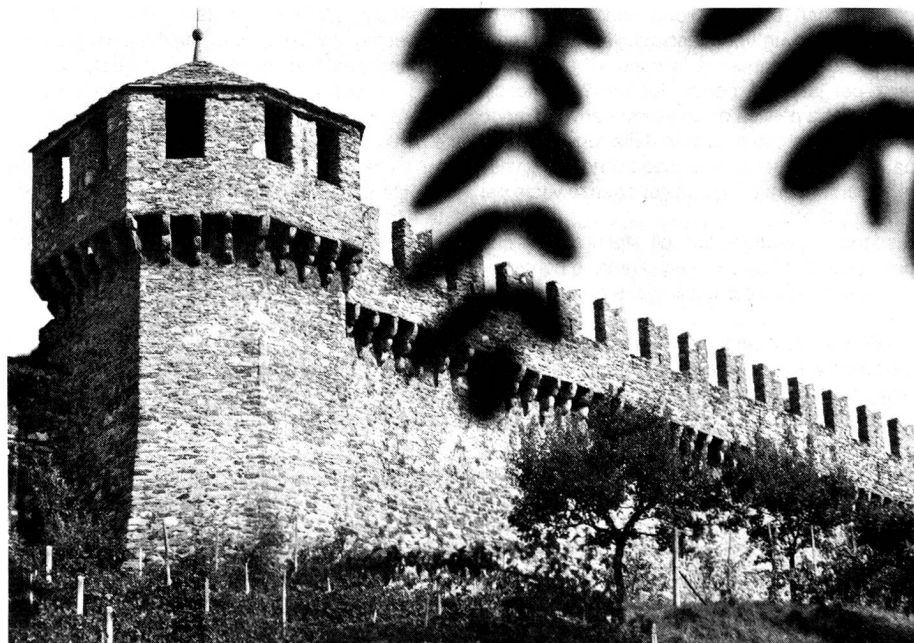
Das Schloss Schwyz oder Montebello aus der 2. Hälfte des 15. Jahrhunderts in Bellinzona. Le château de Montebello (seconde moitié du XV e siècle) à Bellinzona.