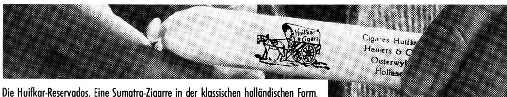
Die Huifkar-Reservados. Eine Sumatra-Zigarre in der klassischen holländischen Form.