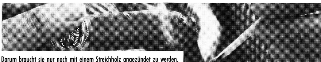
Darum braucht sie nur noch mit einem Streichholz angezündet zu werden.

Von einer Huifkar-Reservados getestet zu werden erfordert keine umfangreichen Vorkenntnisse und ist darum nicht besonders schwierig. Auch wenn Sie sich bis heute nur an Sonn- und Feiertagen oder aus reiner Abwechslung an eine Zigarre heranwagen. Alles, was Sie brauchen, um diesen einmaligen Test bei sich zu Hause, im Büro oder sonstwo erfolgreich zu bestehen, ist ein bisschen Fingerspitzengefühl für die oben dargestellten brenzlichen Situationen. Und natürlich eine leichte und aromatische Huifkar-Reservados, die wir Ihnen nach Erhalt Ihres Coupons gratis zustellen. Alles, was wir von Ihnen wissen möchten, ist, ob Ihnen die Huifkar-Reservados gefällt.