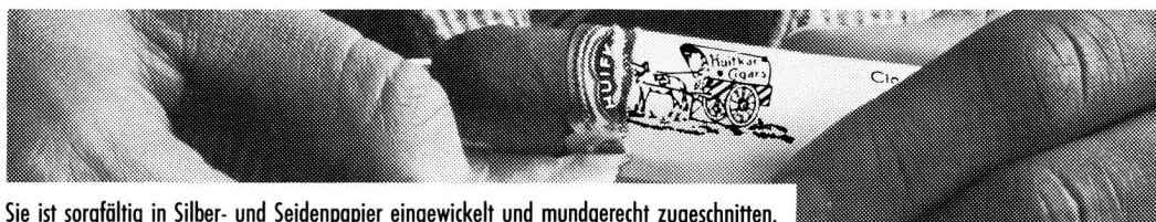
Sie ist sorgfältig in Silber- und Seidenpapier eingewickelt und mundgerecht zugeschnitten.