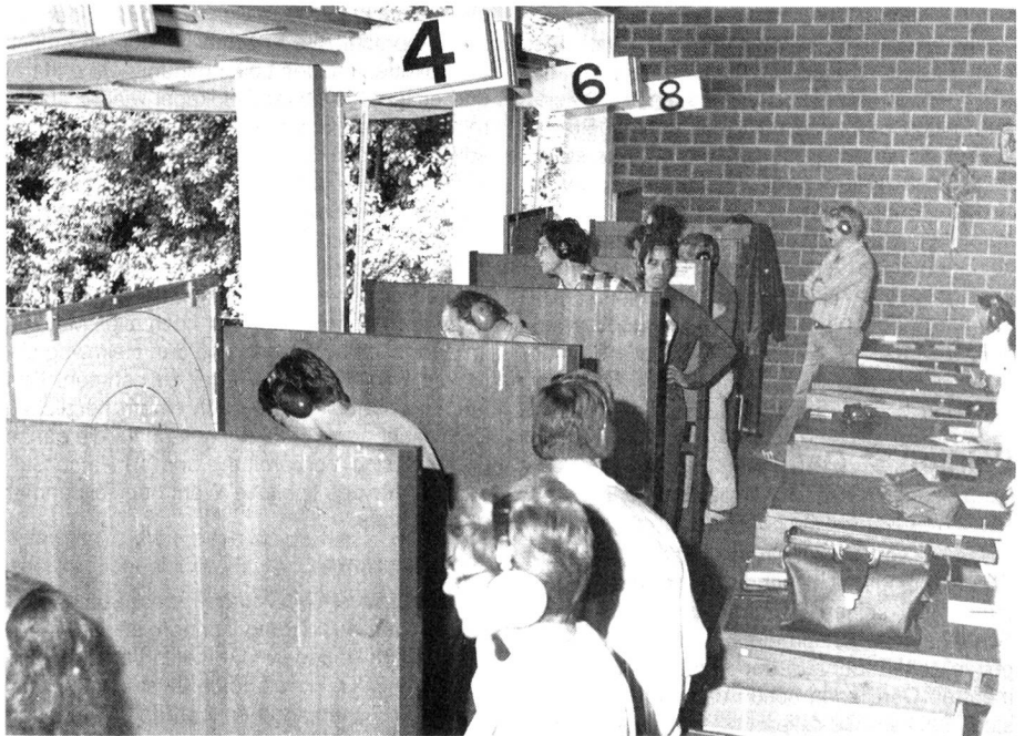
Eifriges Treiben auf allen acht Scheiben: Die Sektion Thurgau bei ihrem ersten Pistolenschiessen in Arbon