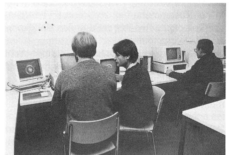
An der Gesamtverteidigungsübung 1984 wurden modernste Kommunikationsmittel und EDV-Applikationen eingesetzt.

nisation stand im weiteren ein Modell elektronischer Entscheidungsfindung zur Verfügung, das an der Universität Freiburg entwickelt wurde. Es kam in der ersten Phase zum Einsatz und hat für die Möglichkeit, die herkömmliche Entscheidungsfassung mit Ergebnissen aus einem zweiten Entscheidvorgang zu konfrontieren, interessante Perspektiven geöffnet. Wir sind gegenüber früheren Versuchen unbestreitbar weitergekommen. Diese Tauglichkeitsprüfung technischer Innovationen war aber keineswegs die einzige. In sehr vielen Bereichen der übenden Führung