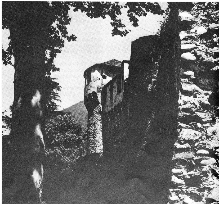
Il castello visconteo di Locarno che visiteremo