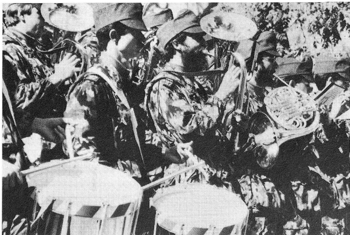
Ein Militärspiel in Aktion! Obwohl unsere Militärmusiker nur während drei Wochen jährlich als geschlossene Formationen spielen, müssen sie vom ersten Dienstag an voll einsatzbereit sein, ohne zuvor zusammen geübt zu haben. Ihr Können und ihr musikalisches Niveau sind weltweit anerkannt. Die neue Schallplattenserie «Unsere Märsche» enthält Kostproben aus dem reichen Marschrepertoire der Schweiz.