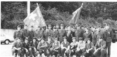
Siamo un'armata di pace, gioia, libertà

Sono sicuro che questi giovani hanno potuto usufruire delle esperienze vissute, le stesse approvate dai veterani che oggi guardano con soddisfazione ed un certo orgoglio questo «quadro».