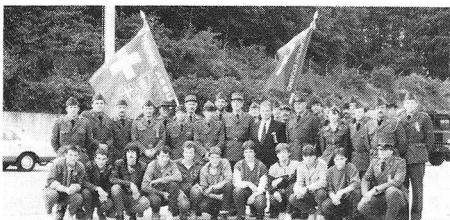
Siamo un'armata di pace, gioia, libertà

Sono sicuro che questi giovani hanno potuto usufruire delle esperienze vissute, le stesse approvate dai veterani che oggi guardano con soddisfazione ed un certo orgoglio questo «quadro».