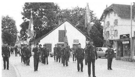
Tutti in fila

Durante i pasti e la festa «in famiglia» del sabato sera si è presentato un quadro bellissimo, dai colori giovani e vivaci, pieno di volontà ad incontrare il futuro.