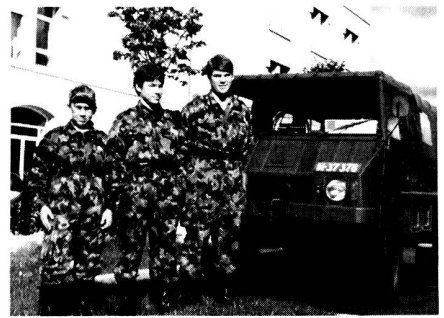
De futurs juniors vaudois

biles lorsqu'on voit notre croix fédérale et le pourpre qui l'entoure remplacés par du noir. S'agit-il de voitures de «la zone», d'un agrandissement du volatil qui prend tout l'emblème (parfois même le noir occupe les deux emblèmes) un coup de Vigilance, un incognito partiel, une préparation à une indépendance de la République et Canton? A Aoste, ce sont les anciennes plaques qui étaient noires, mais portaient le fanion, à FL, idem. Des explications avant qu'on voie... rouge!