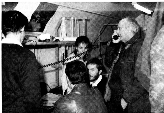
tutto funziona bene.