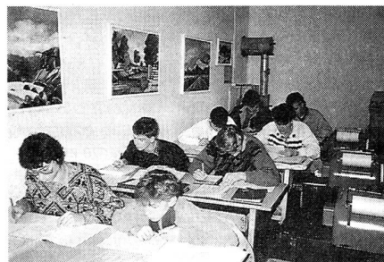
Die Kursteilnehmer bei der Prüfung über den Starkstrombefehl.

Zurzeit steht der Starkstrombefehl auf dem Kursprogramm. Dabei geht es darum, dass jeder angehende Übermittlungssponier eine Leitung anhand der Masten identifizieren kann und weiss, ob und wie er in der Nähe solcher Leitungen Truppenleitungen bauen darf. Ebenfalls muss er auch Auskunft geben können, wie hoch die Spannungen dieser Leitungen sind. Im weiteren geht es darum, was zu tun ist bei einem Starkstromunfall.