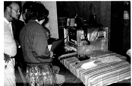
Wiederholungskurse für die Freiwilligen der Übermittlungsabteilung.

schen Entwicklung etwas verlagert. Waren einst profunde Morsekenntnisse notwendig, so sind heute eher Kenntnisse der Computer- und Digitaltechnik gefragt. Der Umgang mit den modernen Übermittlungsmitteln erfordert einen relativ hohen Ausbildungs- und Erfahrungsstand im Umgang mit neuester Technik. Aus diesen Gründen drängt sich der vermehrte Einsatz von lizenzierten Kurzwellen-Amateurfunkern im Korps auf, die dank ihren praktischen Erfahrungen und des dauernden Trainings an ihren privaten Stationen auch in der Lage sind, im Feld Einsatz leistungsfähige Antennen zu bauen und auftretende Störungen zu beheben. Sie verfügen zudem über praktische Erfahrungen über die Ausbreitung von Kurzwellen, was bei der Frequenzoptimierung insbesondere für Weitverbindungen von Bedeutung ist. Neben dem individuellen Training an der privaten Station hat der Freiwillige der Übermittlungsabteilung die Möglichkeit, jedes Jahr an einem Wiederholungskurs teilzunehmen. Zur Erweiterung dieser Trainingsmöglichkeiten wird ein Teil der Kompaktstationen in der Schweiz dezentral aufbewahrt; sie dienen dem Betrieb eines Übungsnetzes, das die Freiwilligen unter Aufsicht fachkundiger Leiter in kürzeren Zeitabständen benützen können.