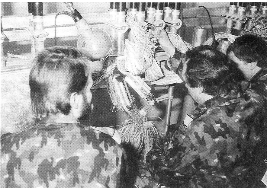
Verteilspleissung im Kabelkeller der neuen Zentrale: 2400 Aderpaare werden aufgeteilt auf 8 x 300.

Zwei Soldaten bildeten jeweils eine Prüfgruppe. Diese erhielt im Einsatzbüro ihre Aufträge vom Detachementschef, der den Grad eines Unter-