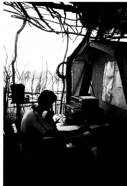
Funker in der Savanne.

Die tägliche Betriebsabwicklung mit der RADIO SCHWEIZ in Bern erwies sich als problemlos. Unsere Station wurde zur vereinbarten Tageszeit gegen Abend auf einer bestimmten Frequenz im 14-MHz-Bereich mit optimierter Antennenrichtung aufgerufen, und daran an-