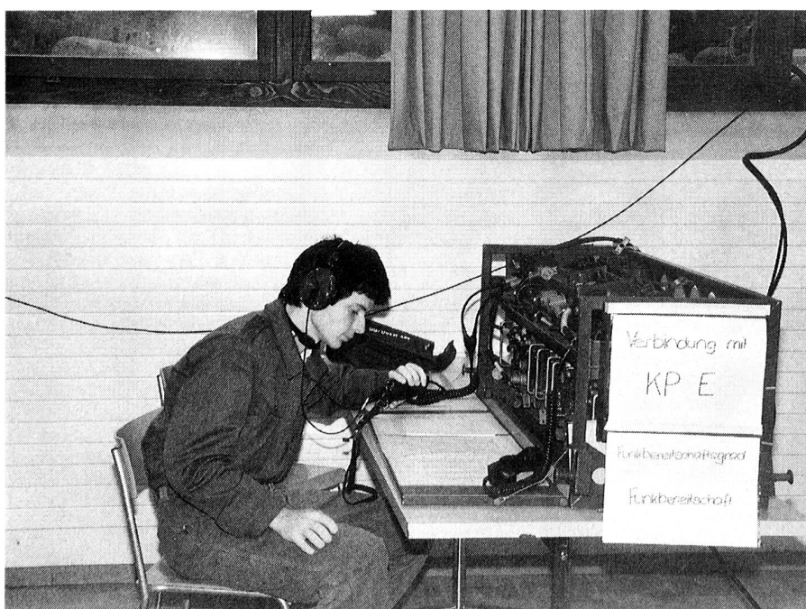
Führungsfunk im Übermittlungszentrum in Uzwil. SE-412 bei der Übung TARZAN.

Im Jahr 1987 waren vor allem diverse längere Militärabwesenheiten unserer Mitglieder zu verzeichnen. Trotzdem konnte eine recht starke Delegation unserer Sektion an der gesamtschweizerischen Übermittlungsübung «ROMATRANS» teilnehmen. Dabei wurden die Uzwiler auf verschiedene Posten verteilt. So konnte schliesslich jeder von einem anderen interessanten Fachgebiet erzählen. Einen besonders starken Eindruck schienen die Briefftauben hinterlassen zu haben. Doch natürlich war auch das kameradschaftliche Zusammentreffen mit anderen Übermittlellern aus der ganzen Schweiz ein besonderes Erlebnis.