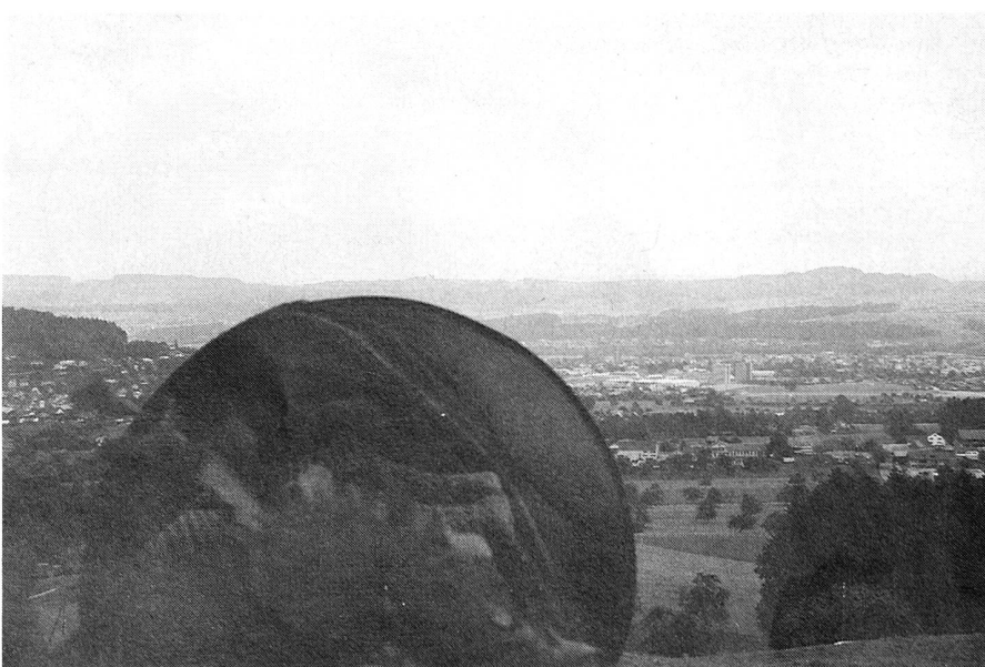
Blick über Uzwil aus der «Sicht» einer Kleinrichtstrahlstation R-902.

barsektionen als Fachexperten. Dies war bestimmt nicht immer eine leichte Aufgabe. Vor allem dann, wenn die Mitgliederzahlen und das Interesse der Mitglieder auf einem Tiefpunkt zu sein schienen, mussten die beiden mit viel Begeisterung für die Sache der Übermittler die Sektion zusammenhalten. Dies ist ihnen auch gelungen. Der EVU Uzwil war in der ganzen Vereinsgeschichte immer dabei. Ob im Basisnetz oder an den gesamtschweizerischen Übungen des Verbandes; ob mit Grosseinsatz oder mit einer kleinen Delegation, die Sektion Uzwil stellte immer ihre Mannschaft.