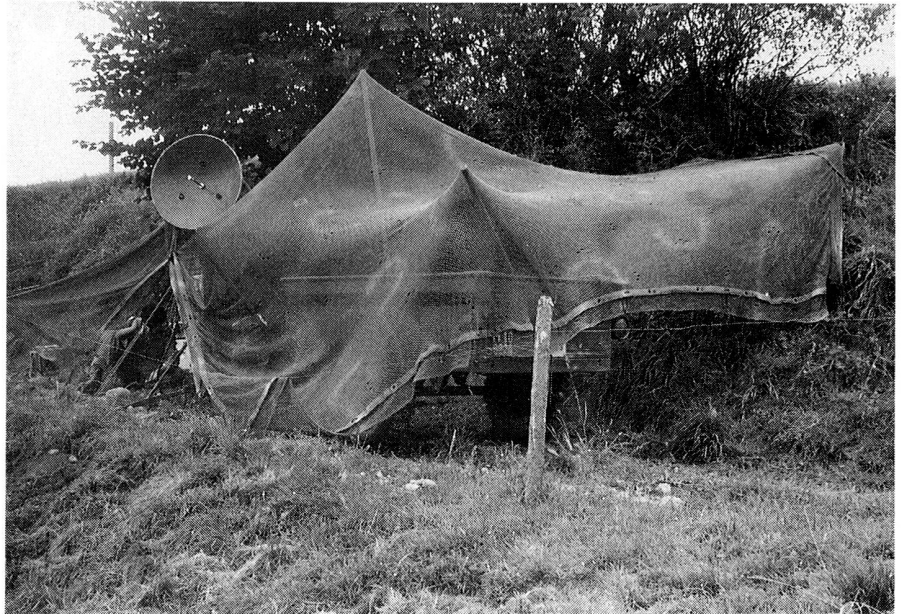
Eine Station R-902 bei einem fachtechnischen Kurs.

Für die Zukunft muss man bestimmt realistisch sein. Das Interesse der Jugend an militärischen