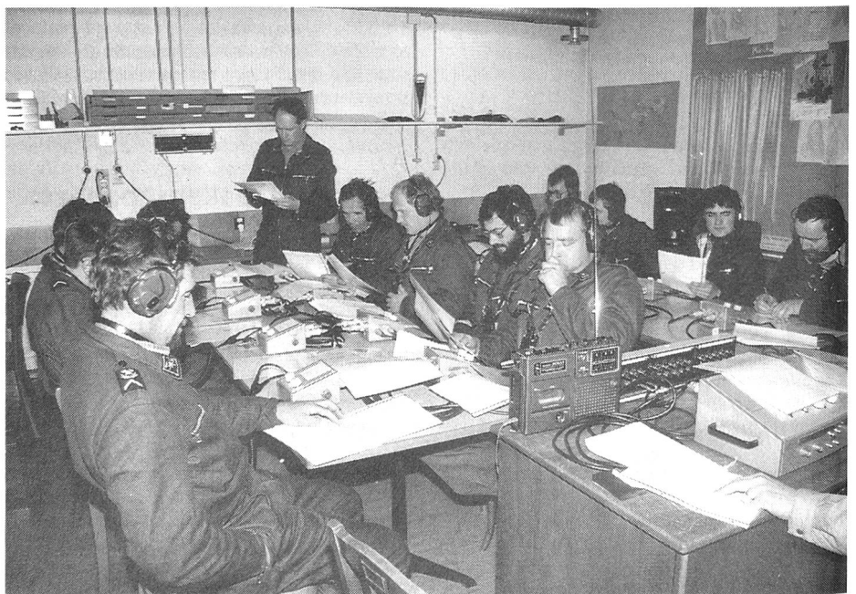
Frischten ihre Kenntnisse im Sprechfunk auf: die Teilnehmer des Open Door-Kurses.

war unsere Sektion mit einer Delegation von 4½ Mitgliedern vertreten. Der «halbe» Delegierte hatte leider das Pech, auf dem Bahnhof