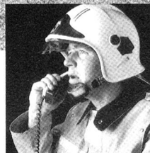
Mehrfachnutzung der Telefonleitung.

Was passiert, wenn etwas passiert? Wenn plötzlich aus einer eher harmlos aussehenden Situation ein Ernstfall wird? Dann ist ein reibungsloser Ablauf von Alarmierung und Mobilisation nötig. Das Zusammenspiel der Kräfte darf keine Lücken haben. Denn: Wenn es mit der Koordination zwischen Alarm und Mobilisation nicht klappt, wenn sich Verständigungsfehler einschleichen oder die Kommunikationswege überlastet sind, dann kann es kritisch werden. Deshalb ist nur eine Gesamtlösung der richtige Weg. Im übrigen auch der wirtschaftlichste! Ascom Autophon AG hat im Bereich Alarm und Mobilisation eine breite Erfahrung anzubieten. Mit Systemen, die sich im harten Einsatz bewähren.