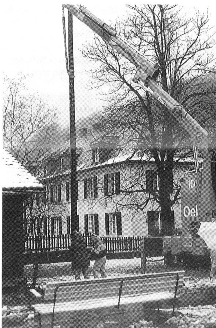
Die Ölwehr stellt Masten

Welche ökologischen Schweinereien macht wohl der EVU, dass die Ölwehr zum Einsatz aufgeboden wird? Zum Glück keine, wie unschwer auf dem Bild ersichtlich ist. Es war den guten Beziehungen von Peter zu verdanken, dass wir für das Stellen des Mastes die Hilfe der Feuerwehr Baden mit ihrem Kran beanspruchen konnten.