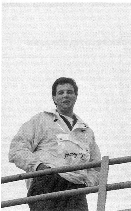
Con buon umore verso il 1990.