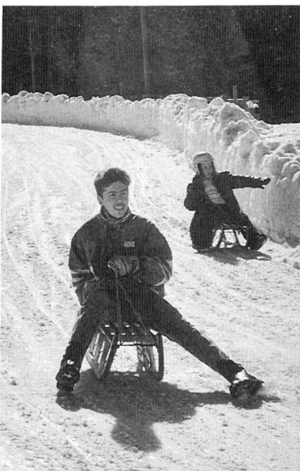
Swen in voller Fahrt, hinunter ins Tal.