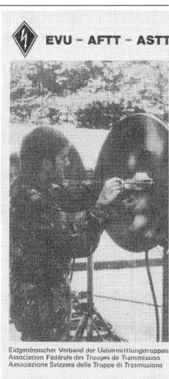
Eigenständiger Verband der Übermittlungstruppen Association Fédérale des Truppes de Transmission Associazione Svizzera della Truppa di Trasmissione

Nächstes Erscheinungsdatum: 3. Dezember 1991