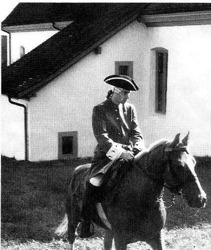
Vom «ehemaligen Meldeläufer zum...

Damit hatten die Hochwachten, die zweifellos einer gewissen Romantik nicht entbehrten, endgültig ausgedient. Vor dem letzten Weltkrieg aber, als unserem Land grosse Gefahr drohte, erinnerte man sich ihrer wieder. Rund 200 Fliegerbeobachtungsposten wurden genau am Ort früherer Hochwachtfeuer eingerichtet!