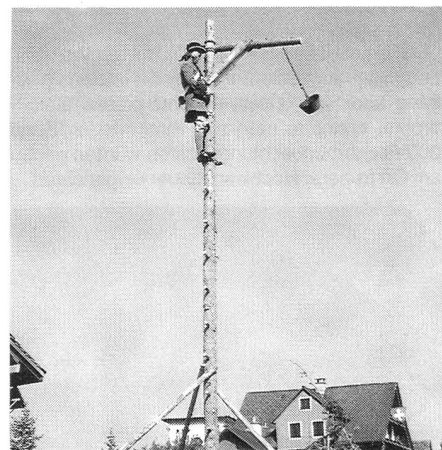
«Harzstud» – das «Übermittlungsgerät» zur Zeit der Hochwachten.

Ein Alarm wurde auf einer Hochwacht entweder mit einem brennenden Holzhaufen oder mit einer Harzpfanne weitergemeldet. Die Holzstöße waren auf raffinierte Weise pyramidenförmig aufgeschichtet, so dass sie augenblicklich entfachten und eine hohe Feuersäule entstehen liessen. Kleinere Hochwachten bedienten sich der Harzpfanne, welche nach dem Entzünden an einem galgenähnlichen Gerüst – der «Harzstud» – in die Höhe gezogen und geschwenkt wurde. Das rote Feuer des brennenden Harzes war weithin sichtbar.