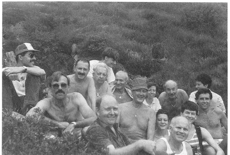
Felici e contenti.