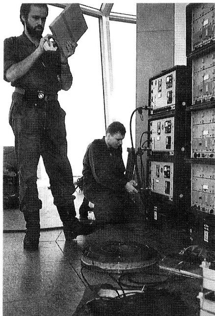
Ein Teil der Anlagen in der Richtstrahlkanzel.

«Prüfstand Schweiz» Ausblicke im Jubiläumsjahr, ISBN 3-85717-067-0, 164 Seiten, illustriert, Fr. 37.–, Th. Gut & Co. Verlag, 8712 Stäfa.