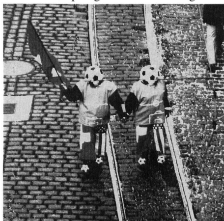
Die Fussball-WM zog auch die Fasnächtler in ihren Bann

sich der Umzug durchschlängeln konnte. Pünktlich um 14.30 h gings dann los. Angeführt vom Fasnachtsbär begann der Umzug. Die einzelnen Uebermittler wurden auf die Umzugsgruppen verteilt. Sie hatten die Aufgabe, den Umzug immer am Laufen zu halten. Doch dies war einfacher gesagt denn getan. Wie es die Fasnacht so in sich hat, ging es ziemlich chaotisch zu und her. Da machte wieder eine Guggenmusik ein Ständchen und schon geriet der Bandwurm ins Stokken. Da waren dann die Uebermittler gefragt, die sofort mit sanftem Druck die Fasnächtler vorantrieben. Auch der Empfang mittels den Funkgeräten