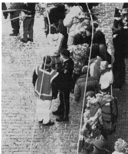
Die Zusammenarbeit zwischen dem Freiwilligen Brandkorps und dem EVU harmoniert bestens

damit die jeweiligen Guggenmusiken sich orientieren konnten. Nach der kurzen Befehlsausgabe trafen sich die Uebermittler mit den Feuerwehrmännern des Freiwilligen Brandkorps der Stadt Bern. Gemeinsam wurden kurz vor dem Umzugsbeginn die restlichen Absperrungen angebracht. Danach verteilten sich die Feuerwehrmänner entlang der Umzugsroute. Sie hatten die Aufgabe, die Zuschauer einigermaßen im Zaume zu halten, damit noch ein kleiner Korridor offen blieb, wo