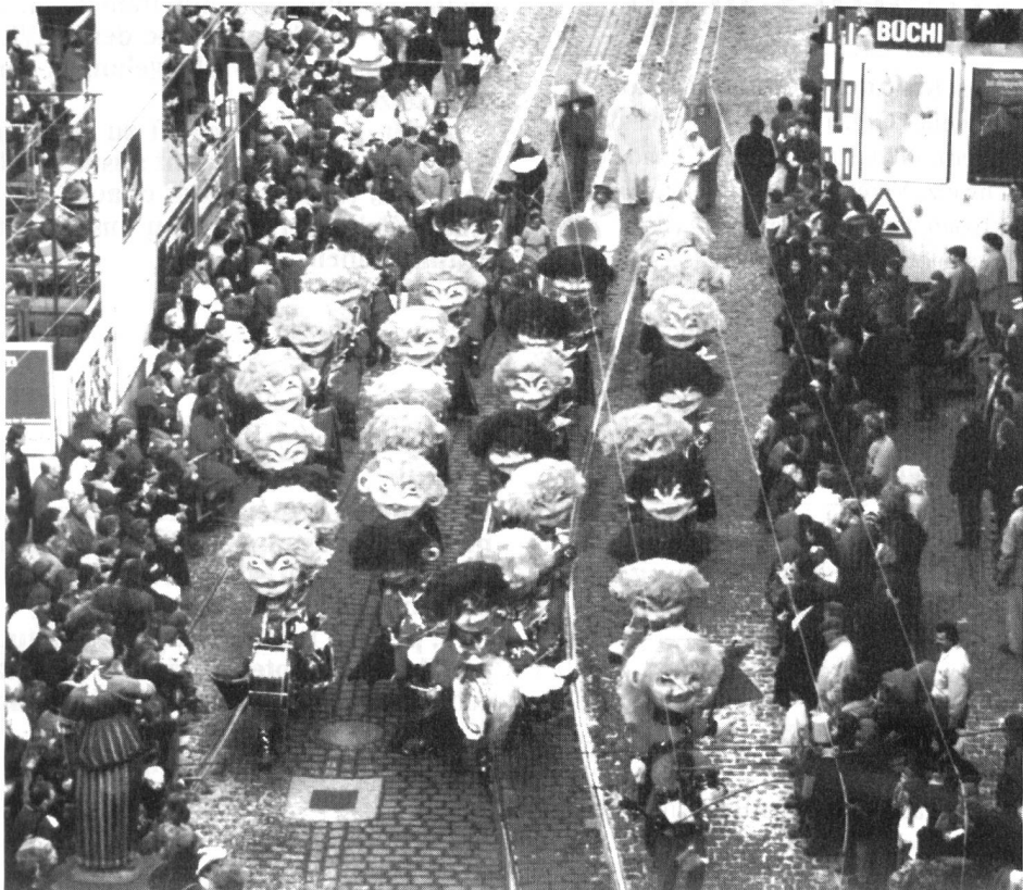
Mit viel Getöse ziehen die Guggenmusiken und die Berner Gassen

Der Auftrag der EVU Sektion Bern war, den Umzug geordnet und so rasch als möglich und ohne Verzögerung zu leiten. Die Umzugsroute begann am untersten Teil der Altstadt bei der Nydeggbücke, danach ging es durch die Gerechtigkeitsgasse, zum Zytgloggenturm,