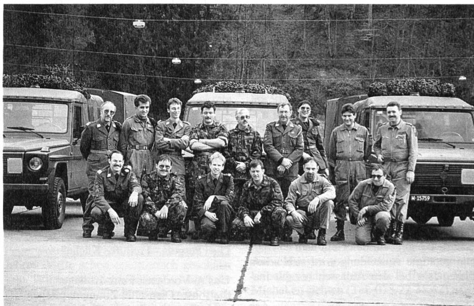
Die Teilnehmer des Puch-Kurses

Die 5 Mitglieder der GMMB zeigten uns, was man beim Parkdienst erledigen muss,