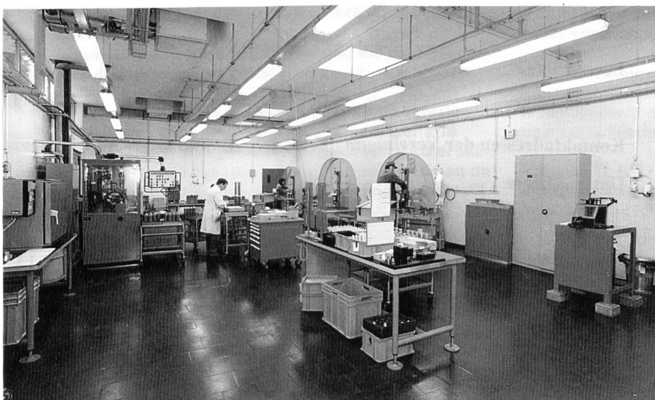
Raum für Munitions-Montage

Die Ergebnisse dieser Strukturbereinigung