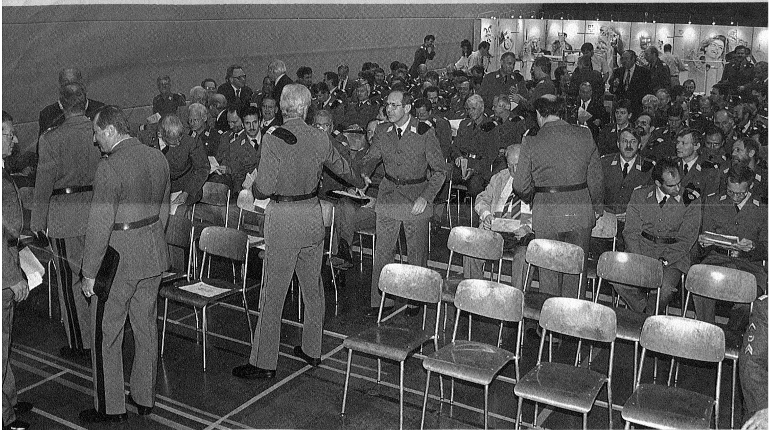
Generalversammlung der Ftg / Ftf in Näfels GL

Organo ufficiale dell'Associazione Svizzera delle Troupe di Transmissione e dell'Associazione Svizzera degli Ufficiali e Sottufficiali Telegrafo da Campo