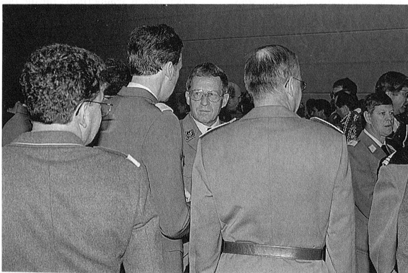
Ein wichtiger teil der GV Ftg/Ftf ist die Pflege der verschiedenen persönlichen Kontakte