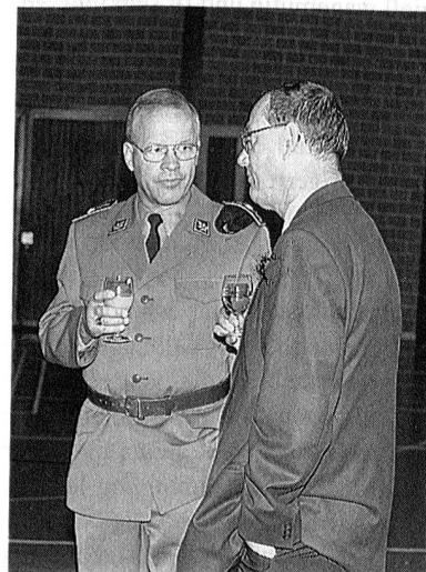
Pflege des persönlichen Kontaktes