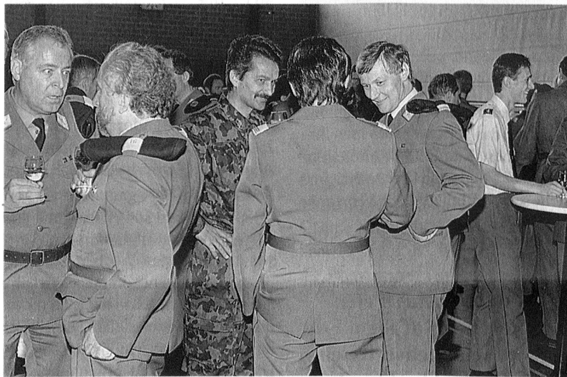
Ein wichtiger teil der GV Ftg/Ftf ist die Pflege der verschiedenen persönlichen Kontakte

In der Ftg u Ftf Br 40 mit deren Betr Gr gibt es 537 Offizierspositionen. Mit den 112 Feldtelegrafentoffizieren in den Stäben außerhalb unserer Brigade benötigen wir also gesamthaft