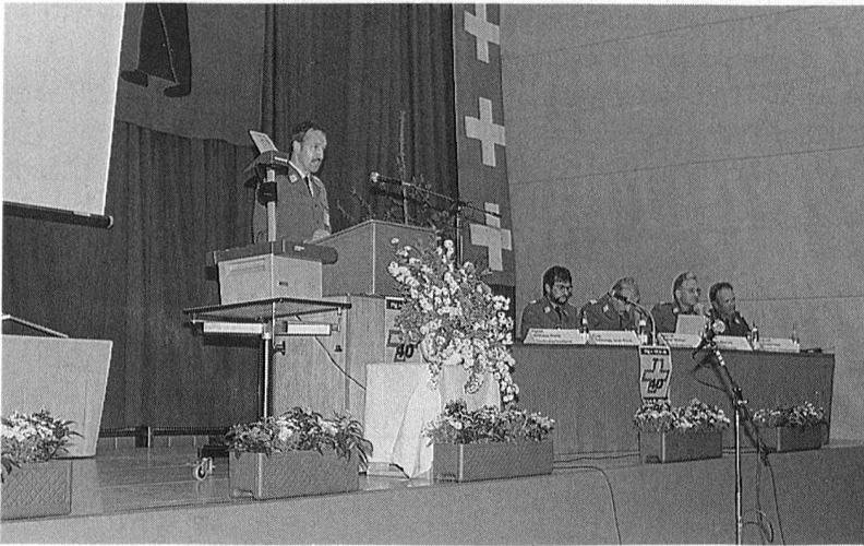
Präsident und Vorstand der amtierenden OG-Rapperswil