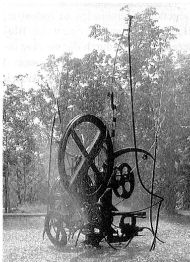
FONTAINE DE JEAN TINGUELY dédiée au coureur automobile Jo Siffert

catholicisme au sein de la république protestante de Berne à la Réforme, Fribourg devient progressivement un pôle économique, parachevé au milieu du XIXe siècle par la construction de la ligne de chemin de fer Berne-Lausanne et de la gare de Fribourg autour de laquelle va se développer l'agglomération moderne. Mais ce n'est que dans le dernier tiers du XXe siècle que la capitale fribourgeoise et sa ceinture de communes suburbaines connaîtront leur véritable essor industriel et commercial qui lui donnera une dimension internationale. L'héritage, laissé en revanche par le cours de l'histoire, s'avère depuis longtemps un perpétuel enchantement et une source intarissable de découvertes: maisons bourgeoises de style gothique tardif et baroque, rues et places pittoresques, ponts séculaires, églises et chapelles gardiennes de l'art sacré (autels, sculptures, peintures, vitraux). L'ensemble urbanistique de la cité ancienne, d'une étonnante beauté et remarquablement conservé, s'avère une curiosité unique en Suisse.