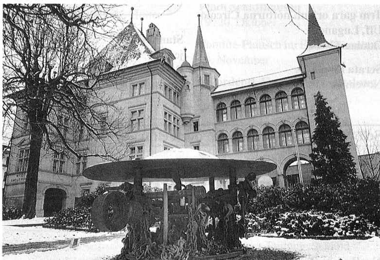
MUSEE D'ART ET D'HISTOIRE (HOTEL RATZE)

Bien que petite de taille, la ville de Fribourg est importante en raison de sa fonction de centre administratif de toute une région, et surtout de la présence en ses murs de nombreux sièges de sociétés internationales. Elle dispose en outre de tous les services d'une grande ville. son rayonnement international lui vient de sa vocation de centre d'étude, dû à ses nombreux instituts d'éducation et à son université catholique comptant pas moins de 7'100 étudiants venues des cinq continents. La ville est également dotée d'un sec-