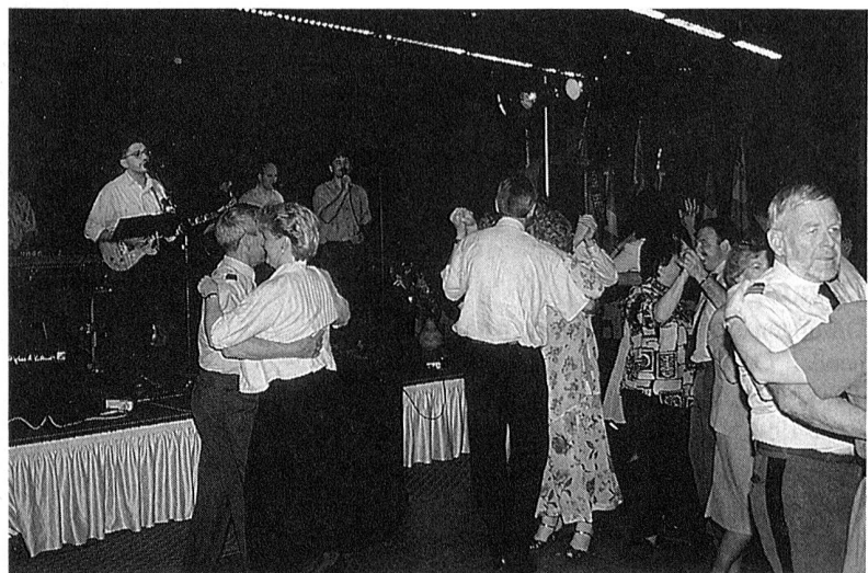
Fröhlich Stimmung durch die Tanzband "Cocktail" während des Abendprogramms.

Der konnte uns mit seinen Kunststücken sehr imponieren. Er liess Armbanduhen von den Handgelenken so-