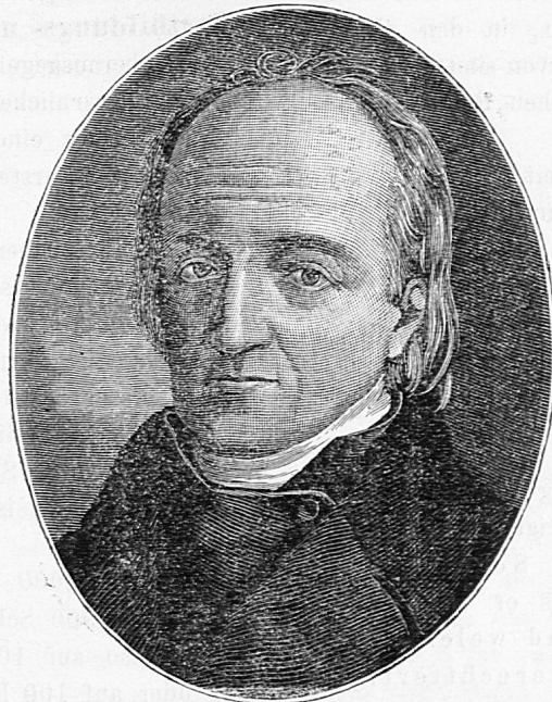
Emanuel von Fellenberg