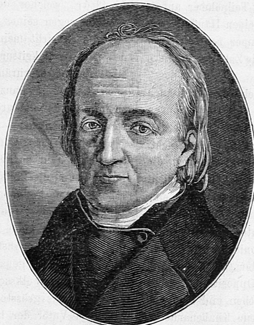
Emanuel von Feilenberg