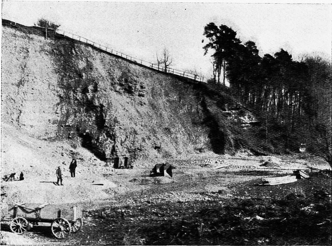
Fig. 3. Älterer Diluvialschotter bei Wiggiswil.

2. Östlich von Wiggiswil ist verfestigter älterer Schotter in besonderer Mächtigkeit und Ausdehnung vorhanden, und zwar zunächst in der grossen Kiesgrube zwischen der Ortschaft und dem Bubelohwald und sodann auch in diesem selbst. An beiden Orten wird der Untergrund bis zu der Meereshöhe von ungefähr 545—550 m durch Sandstein der untern Süsswassermolasse gebildet.