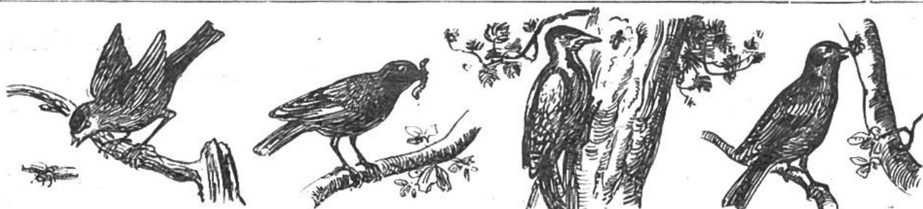
Meise. Fr. 30.—