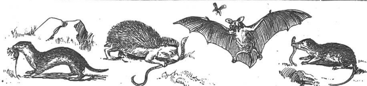
Gr. Wiesel. Fr. 40.—