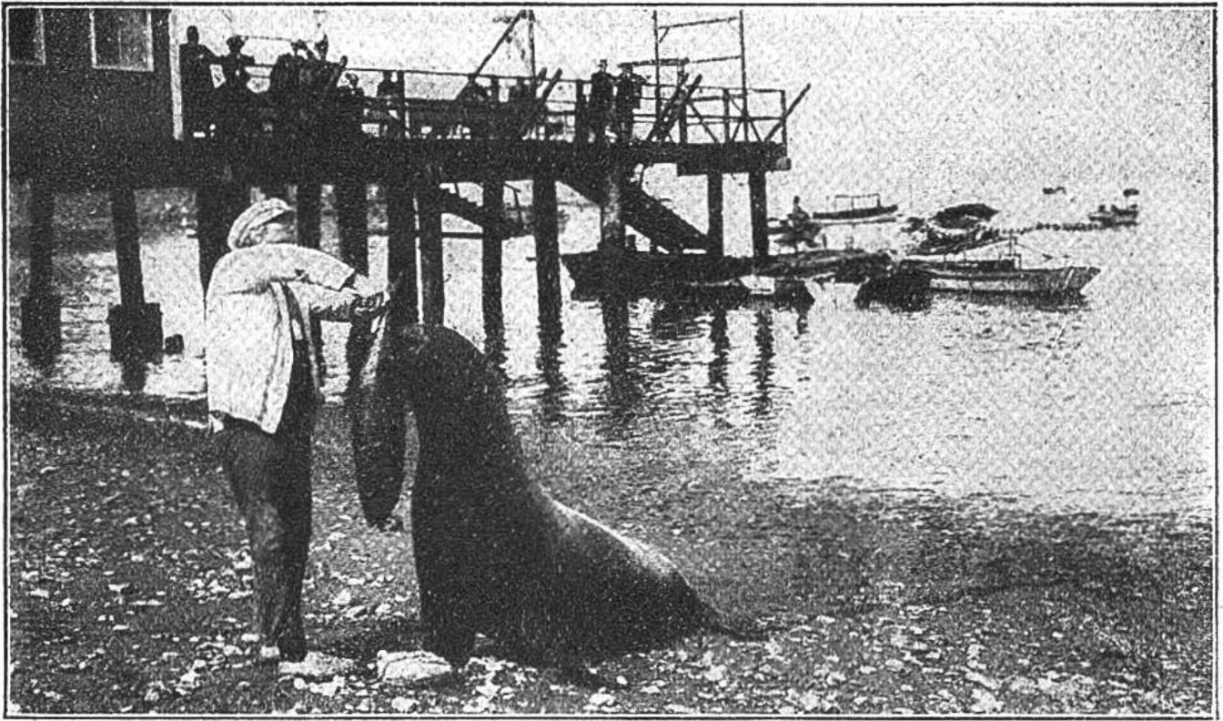
Fütterung eines Seelöwen