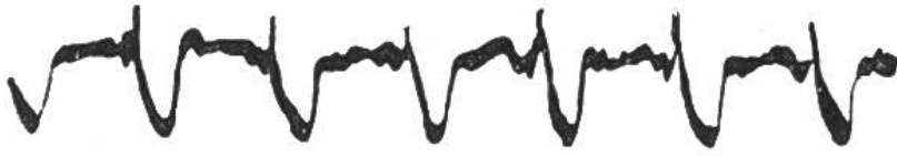
Aufgezeichnete Schläge eines gesunden Herzens

Ein vernünftig geübter Sport schärft den Willen und die Energie, er kräftigt den Körper und macht ihn widerstandsfähig; jede