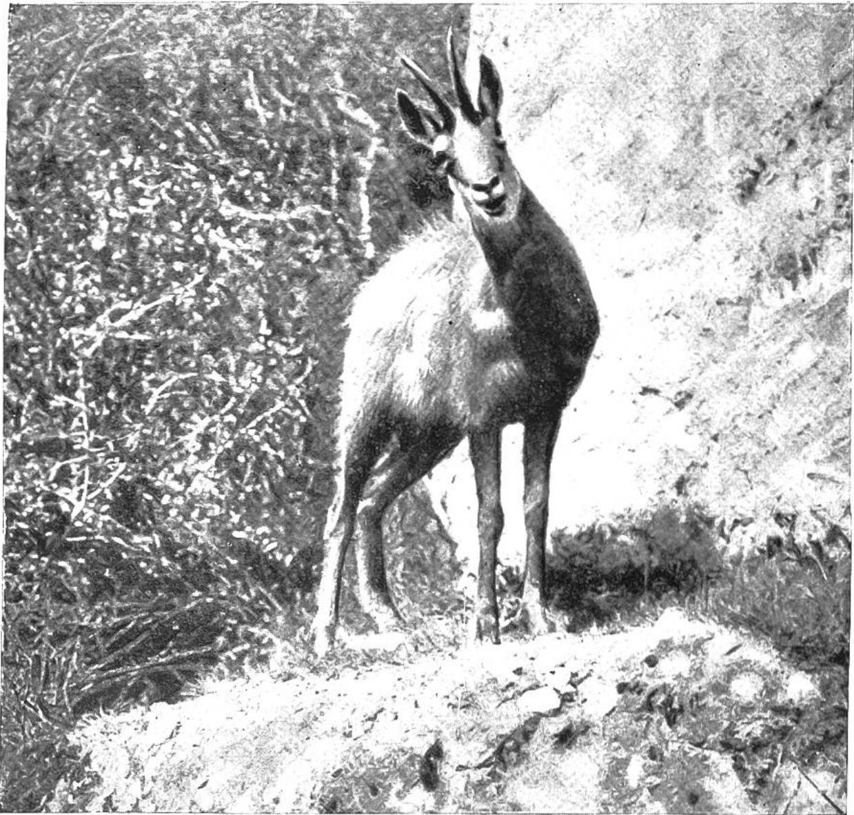
Sichernde Gemse in den Alpen (Photogr. Aufnahme nach Natur).