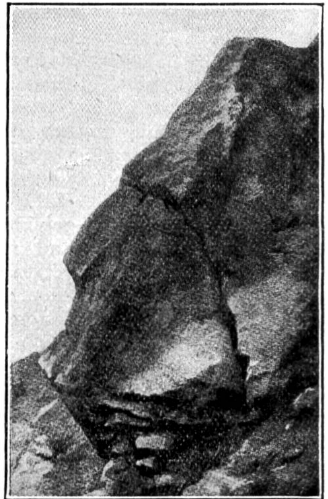
George Washington-Felsen bei Süd-Bethlehem in Pennsylvanien N. A.

Wie die Japaner nun ihre kleinen, schöngezeichneten Kieselsteine mit äusserster Sorgfalt behandeln, so sollten auch wir unsere Naturdenkmäler möglichst unver-