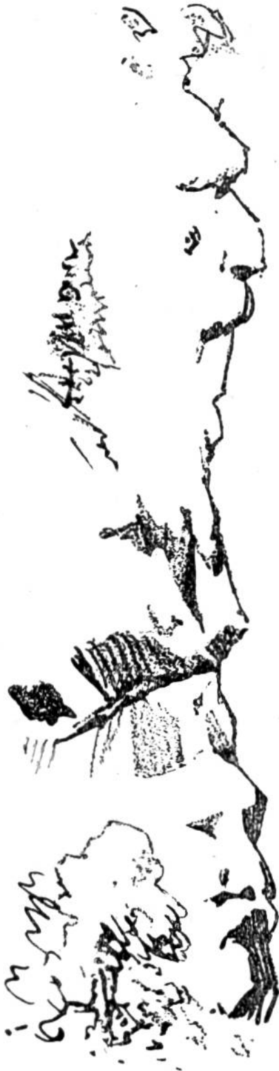
Felsenköpfe bei Meyersboden im Schanfigg.