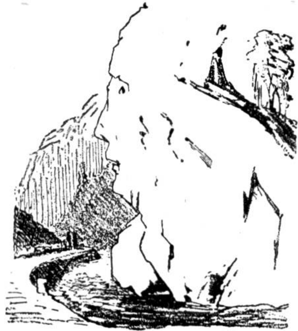
Felsenkopf bei Meyersboden im Schanfigg.

Interessante Felsgebilde sieht man im Schanfigg bei Meyersboden, eine Stunde oberhalb Chur, wo Schieferfelsen zu Tage treten. Am auffallendsten präsentiert sich uns, aus der Plessur aufsteigend, ein kolossaler Kopf, dessen Nase allein eine Höhe von etwa 4 Meter hat. Nur schade, dass ihn ein Felsblock verunstaltet, der ihm durch seine Lage einen Kropf verleiht. Ohne grosse Mühe können die übrigen hier abgebildeten Figuren herausgefunden und neue entdeckt werden. Selbstverständlich sehen diese nicht von allen Seiten so aus, ausgenommen die erstere, welche 40—50 Schritte weit das nämliche Profil zeigt.