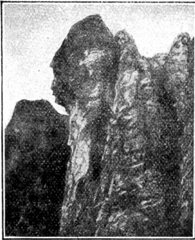
Der Mönchskopf von Neu-Mexiko.

sehr zu erhalten suchen. Die Steine wirken oft nur so überraschend, weil sie mitten aus einer unverdorbenen Naturlandschaft herausragen. Die menschliche Arbeit aber kann diese schönen Züge leicht gänzlich verderben. Ein Haus, das unbedachterweise in die Gegend gestellt wurde, kann die Aussicht auf das merkwürdige Bild verdecken, Telephon- und Telegraphenstangen können die Züge entstellen, Strassen neue Furchen in das Gesicht reissen. Vielleicht ist es hie und da, wenn auch mit aller Vorsicht, zu empfehlen, der Verwitterung, die ebenfalls solche Steine verdirbt, durch vorsichtige Maurerarbeit entgegen zu arbeiten.