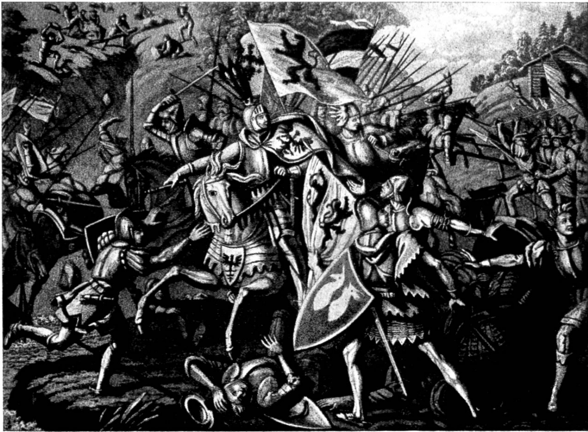
Schlacht bei Morgarten. 16. November 1315.