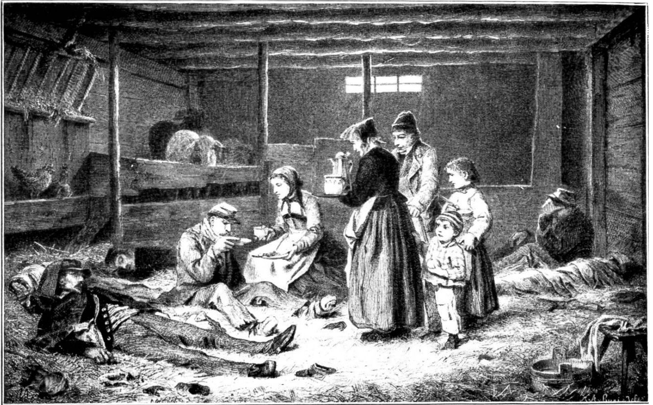
Berner Landleute, Soldaten aus der Bourbakischen Armee verpflegend. — Nach seinem Ölgemälde auf Holz gezeichnet von A. Anker