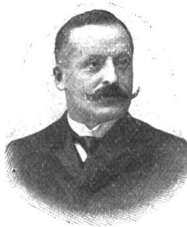
Dr. Giuseppe Motta (Tessin) geb. 1871, seit 1912 i. Amte.