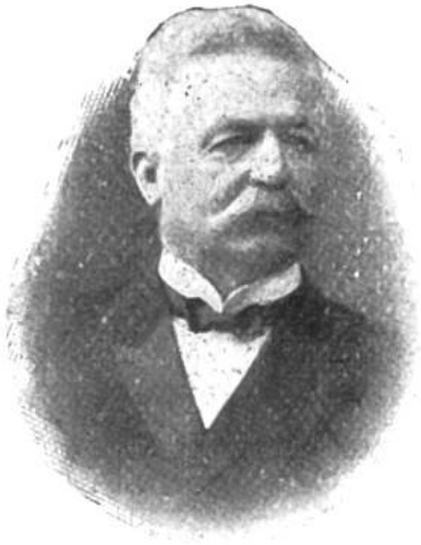
Dr. Eduard Müller (Bern) geb. 1848, seit 1895 i. Amte.