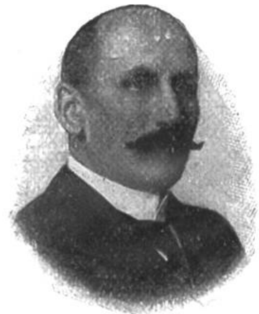
Dr. Felix Calonder (Graubünden) geb. 1863, seit 1913 i. Amte.