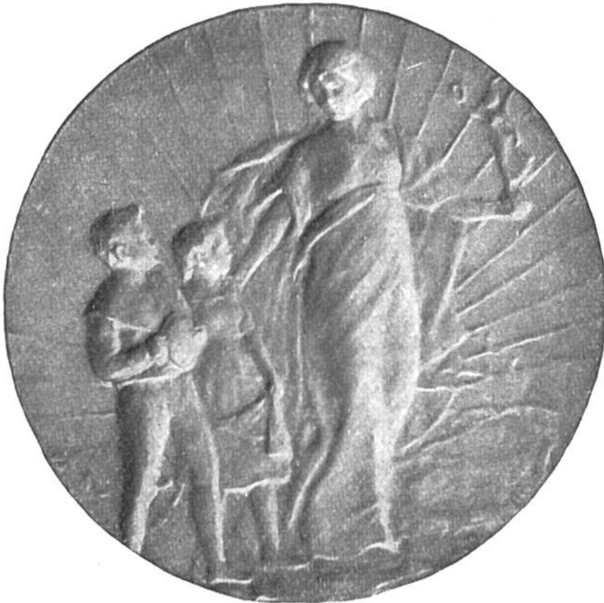
Ehrenkreuz mit grosser goldener Medaille Ausstellung „Kind und Kunst“, Wien 1912

der Pestalozzi-Kalender (Ausgaben deutsch, französisch, spanisch in den Jahren 1912 und 1913.