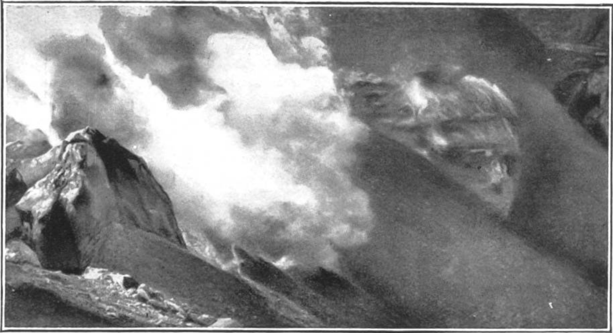
Im Krater des Vesuv.