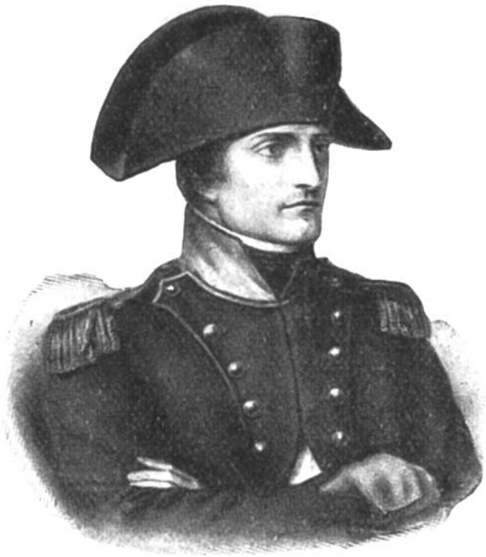
Napoleon als I. Konsul (1799 mit den Rechten eines konstitutionellen Fürsten auf 10 Jahre gewählt).