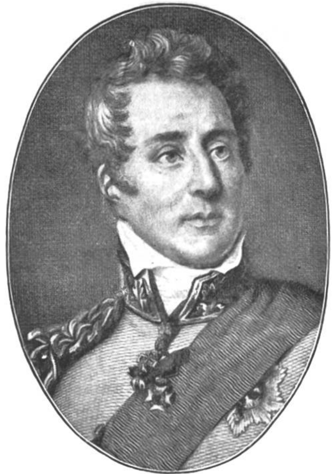
Herzog von Wellington.