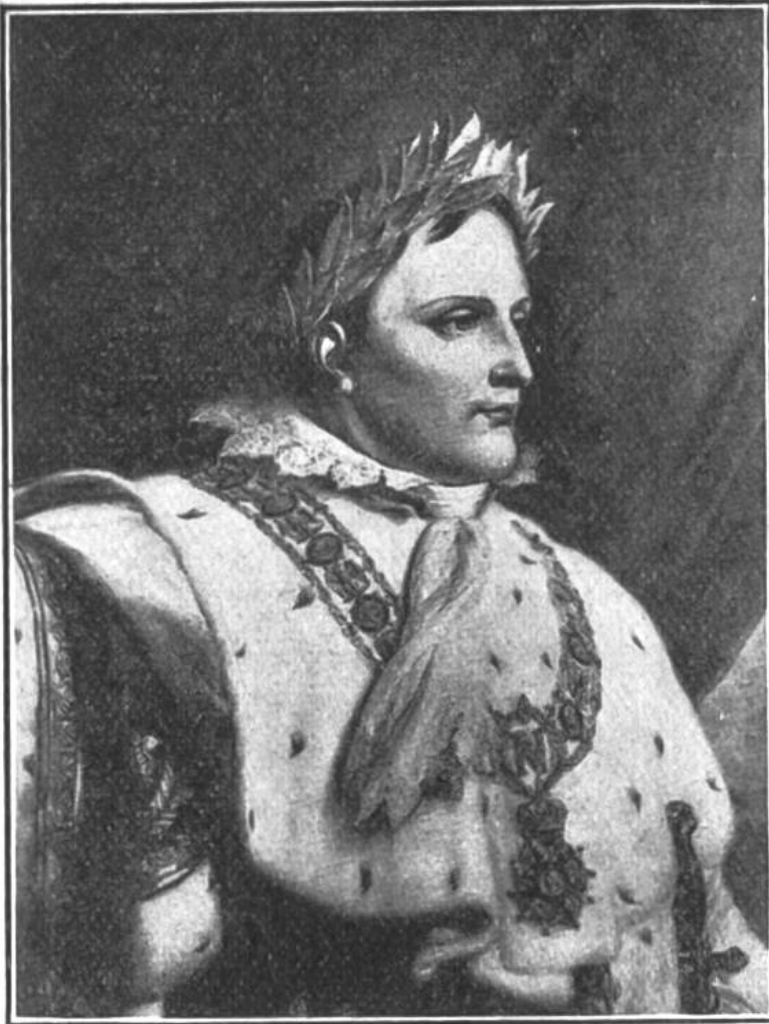
Napoleon I. als Kaiser.

(Proklamation durch den Senat zum erblichen Kaiser 20. Mai 1804. Krönung durch den Papst in Paris 2. Dez. 1804.)