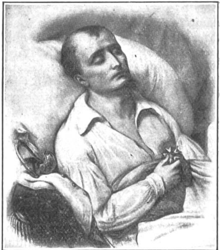
St. Helena. 5. Mai 1821. Napoleon I. auf dem Totenbette, in der Hand hält er das Kreuz d. von ihm begründeten Ehrenlegion.

Napoleon heiratete sogar die Kaisertochter Luise. Als Russland seinen Verfügungen nicht gehorchen wollte, erklärte er den Krieg, schlug im russischen Feldzug den Feldherrn Kutusow bei Smolensk und Borodino, nahm Moskau ein, musste sich aber mitten im strengsten Winter zurückziehen, weil die Russen keinen Frieden schlossen, die Stadt Moskau verbrannten, und weil das eigene Heer zusammenschmolzen war. Auf dem Rückzug wurde