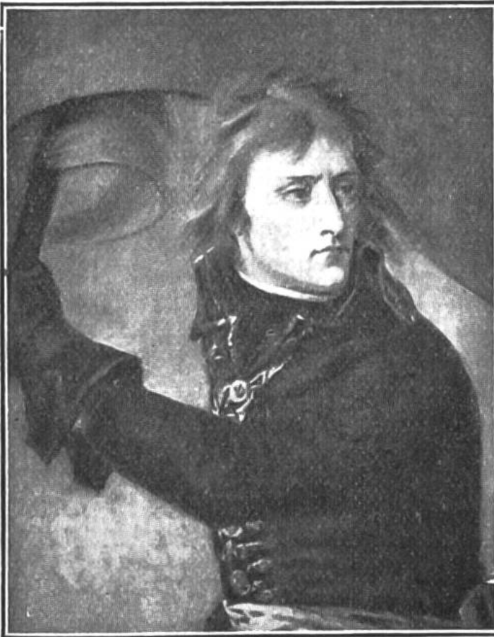
Gemalde von J. A. Gros