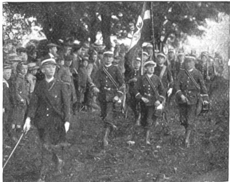
Kadetten des Berner Waisenhauses defilieren.

Unsere Kadetten sind in dieser Zeit dem Vaterlande von grossem Nutzen gewesen. Die Jungkriegervereine sind eine alte, schweizerische Einrichtung; Kaiser Sigismund begrüßte 1415, als er in Bern einzog, die Bernerknaben, die ihn in kriegerischem Aufzuge in die Stadt begleiteten, mit den frohen Worten: „Da wächst uns eine neue Welt!“ Die Kadettenkorps haben ihre Mitglieder früh zu tüchtigen Soldaten ausgebildet; sie haben damit ihr Teil beigetragen zum Schutz unseres Vaterlandes. Die uns umgebenden feindlichen Mächte achteten die Neutralität des Schweizerlandes, weil sie vor der kleinen, aber kriegstüchtigen Schweizerarmee Respekt hatten.