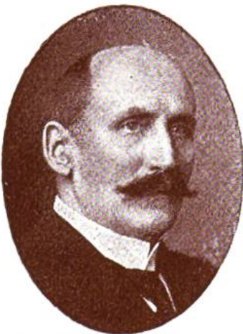
Dr. Felix Calonder von Trins, Grbd. geb. 1863, seit 1913 i. Amte.