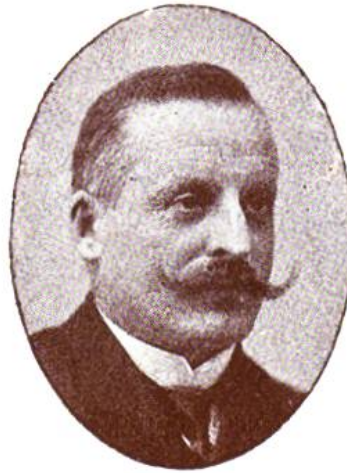
Dr. Giuseppe Motta von Airolo geb. 1871, seit 1912 i. Amte.