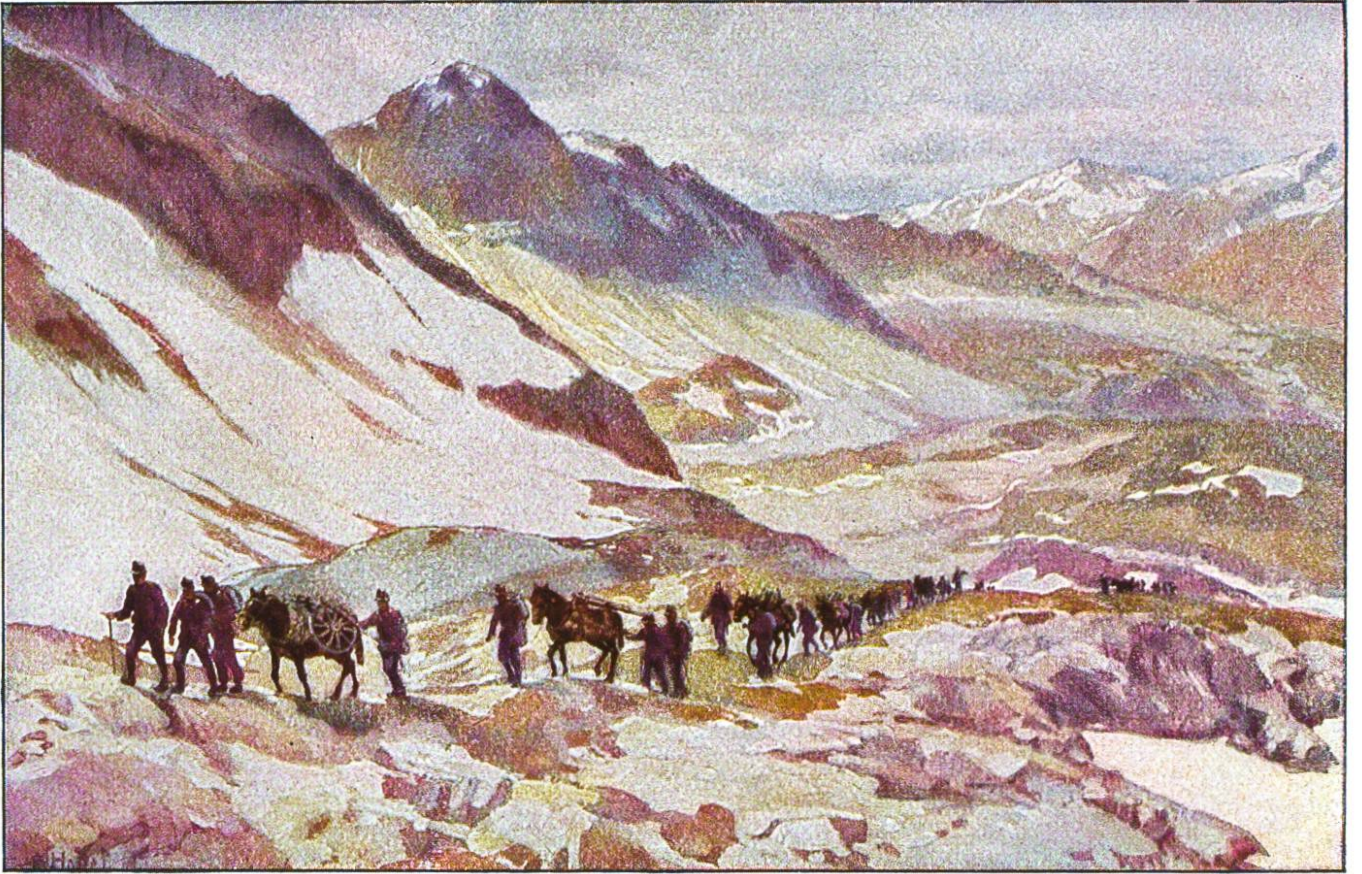
SAUMKOLONNE IM GOTTHARDGEBIET.

Für die Leser des Pestalozzikalenders gemalt von E. Hodel, Luzern.