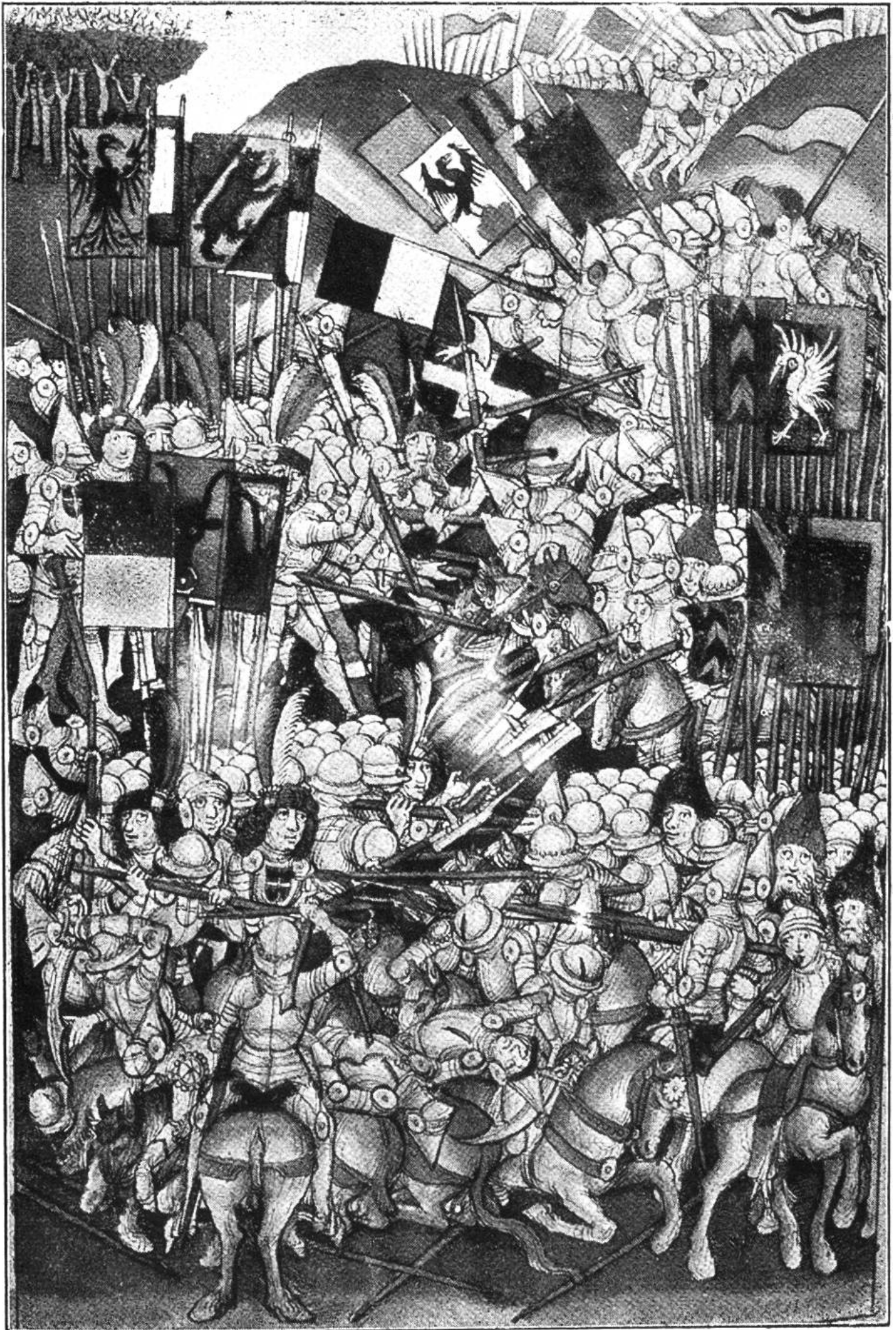
DIE SCHLACHT BEI LAUPEN 21. Juni 1339 (nach Schillings Chronik).