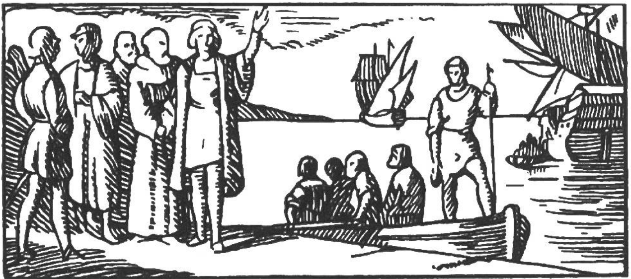
Kolumbus verlässt Spanien zu seiner ersten Entdeckungsreise.