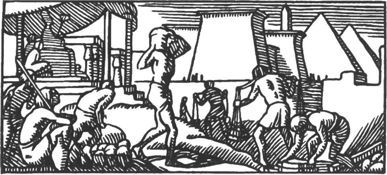
Ägypter beim Pyramidenbau.