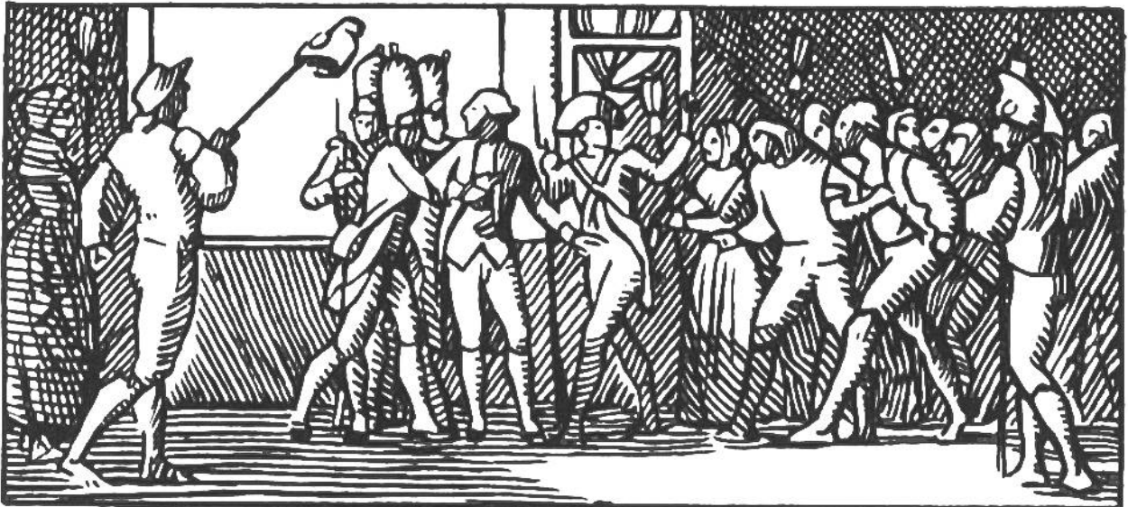
Französisches Volk setzt Ludwig XVI. die Freiheitsmütze auf.