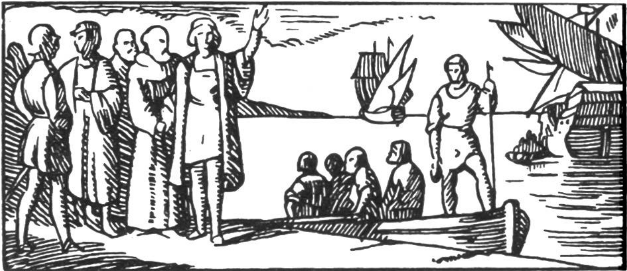
Kolumbus verlässt Spanien zu seiner ersten Entdeckungsreise.