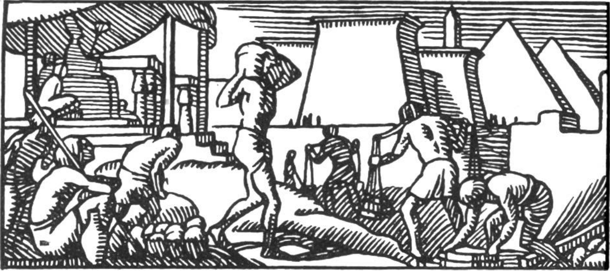
Ägypter beim Pyramidenbau.